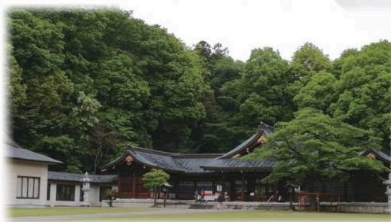
護国神社 本殿・拝殿・参集殿

環境省「つなげよう、支えよう、森里川海プロジェクト」のアンバサダー。自らもSDGsを目標に、千葉県鴨川自然王国にて、水・食料・エネルギーの自給自足を目指しながら、家族と共に大地に根づいた生活をしている。